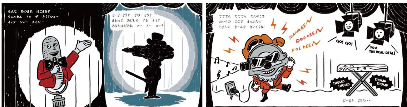
▲「DO GOOD SHOW どうぐ☆ショー」ページ内容(一部抜粋)

「みんな あつまれ はじまるぞ ウェルカム トウ ザ どうぐショー イッツ ショー タイム！！」