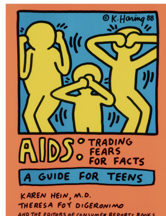
ポスター「エイズ：真実で恐怖をなくそう」1988年 Keith Haring Artwork ©Keith Haring Foundation Courtesy of Nakamura Keith Haring Collection