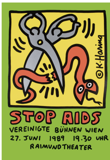
ポスター「ストップ・エイズ」1989年 Keith Haring Artwork