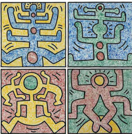
《平和 I-IV》、1987年、多摩市文化振興財団蔵