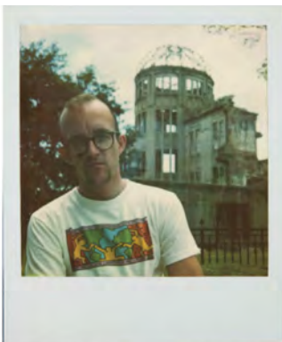
キース・ヘリングと原爆ドーム、1988年

1988年、ヘリングは、広島で行われた原爆養護ホーム建設のためのチャリティコンサート「HIROSHIMA '88」のメインイメージを手がけたことをきっかけに、広島を訪れました。原爆ドームや広島平和記念資料館へ足を運び、戦争の惨さを目の当たりにしたヘリングは、平和への思いを形にすべく壁画制作を申し出ました。しかし、このプロジェクトは実現することがありませんでした。本展では、調査のなされてこなかったヘリングの広島訪問の経緯を辿り、その足跡を紹介します。