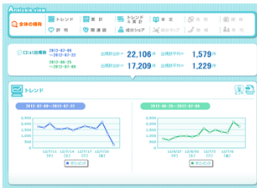
■ 図 1：過去検索機能