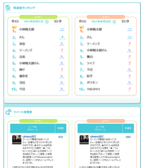
■ 図 2：関連語や影響力の高いユーザの一覧