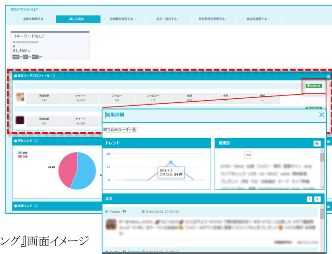
クチコミ@係長『発言回数ランキング』画面イメージ

*本機能は、「クチコミ@係長」のオプション「Twitter 全量収集」のお申し込みが必要です。また、分析が可能な対象期間は、2019年5月以降です。