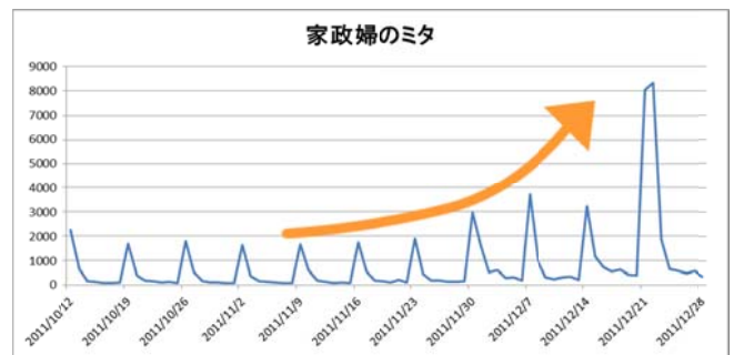
『家政婦のミタ』(NTV) 初回 2,247 件→最終回 8,049 件