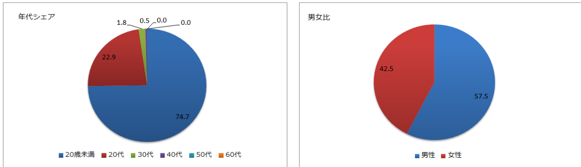
対象 SNS: Twitter10% サンプル、集計期間: 2015年10月13日~2016年10月14日、検索ワード: パリピ、パーリーピーポー

では、パリピという言葉が SNS 上で使用している人はどんな人たちなのでしょう? 年代シェアをみると、20代未満が全体の約4分の3という結果になりました。また、20代も全体の2割を超え、20代未満と合わせてシェア97.6%を占める結果となりました。30代ではわずか1.8%、40代では0.5%、40代と50代では0%とほとんど使われていないことが分かります。また、男女比をみると、男性の割合が約6割と若干多い結果となりましたが、男女ともに使われている言葉であることが分かります。