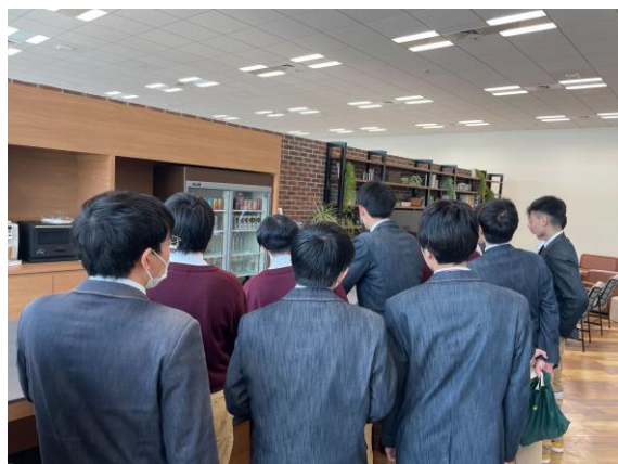
▲オフィスツアーの様子