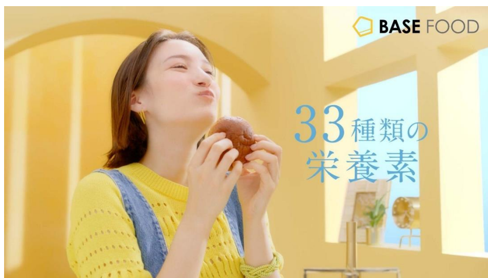
BASE FOOD 初のテレビ CM 「ベースフード 毎朝の健康習慣」編

なお、テレビ CM 放送に先駆けて、福岡県・佐賀県におけるファミリーマートの一部店舗では、完全栄養パン「BASE BREAD（ベースブレッド）」と完全栄養クッキー「BASE Cookies（ベースクッキー）」の販売を1月17日（月）より順次スタートしており、放送開始を機に、九州地方におけるさらなる販売店舗の拡大にもつなげていきます。