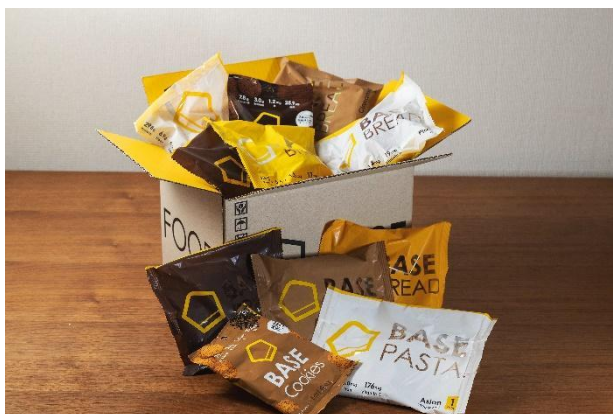
BASE FOOD シリーズ

「BASE FOOD」は、1食（BASE BREAD は2袋分、BASE Cookies は4袋分）で1日に必要な栄養素の1/3がとれる完全栄養食 ※1 です。全粒粉や大豆、チアシードなど厳選した10種類以上の原材料を使用しながら、栄養バランスとおいしさを独自の配合と製法により実現。タンパク質や食物繊維、26種類のビタミン・ミネラルなど1日に必要な33種類の栄養素を1食でとることができます。糖質は約30%オフ ※2 、合成着色料・合成保存料不使用なので、ダイエット中やトレーニング中の方、お子様でも安心して食べることができます。