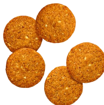
BASE Cookies ココナッツ