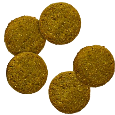
BASE Cookies 抹茶