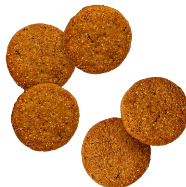
BASE Cookies さつまいも