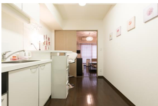
白を基調としたキッチンとカウンターテーブル