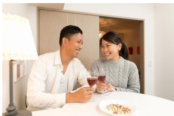
お子様が寝ている間に、夫婦の時間も