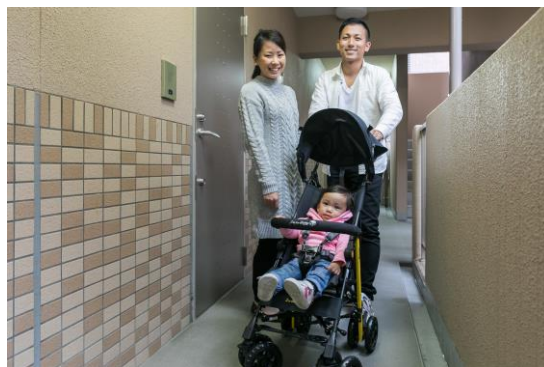
ベビーカーの貸出しも便利