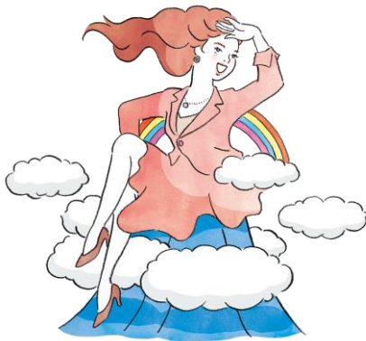
公私ともに人生満足度は高い 「モヤレス」タイプ