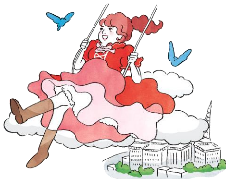
天真爛漫な楽道家 「モヤモヤ無縁」タイプ