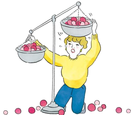
周囲のバランスをとるストレスで 「調整モヤモヤ」タイプ