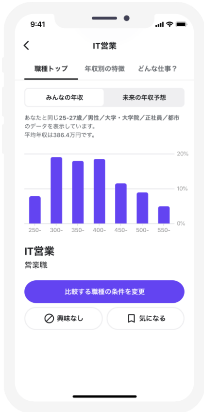
イメージ 1 【年収分布】