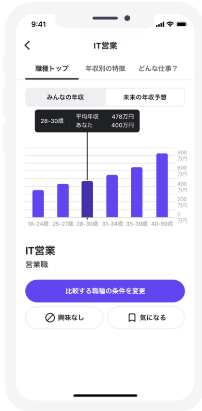
イメージ 2 【将来的な年収予測推移】