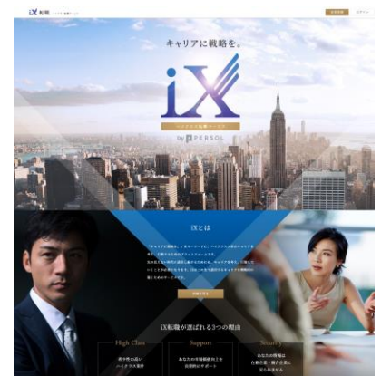
ハイクラス転職サービス サイトイメージ

問い合わせ先 パーソルキャリア株式会社(旧社名: インテリジェンス) 広報部 TEL: 03-6757-4266 FAX: 03-6385-6134 pr@persol.co.jp