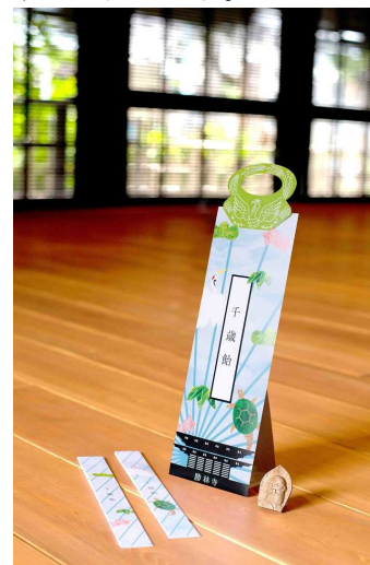
七五三の記念土産 Designed by Nendesign