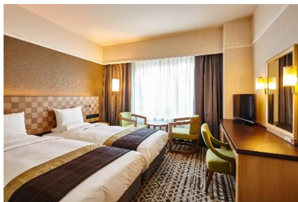
ハリウッドツインルーム