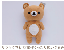
リラックマ初期試作くったりぬいぐるみ

リラックマ、コリラックマ、キイロトリ、チャイロイコグマが登場! 展览会会場でも変わらず、だらだらする様子の立体作品は必見です。また、リラックマの人気商品「あつめてぬいぐるみ」から約200体が勢揃い。