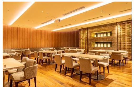
レストラン All Day Dining 紗灯

https://hotelnikko-tachikawatokyo.jp/restaurant/