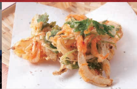
※写真はイメージも含まれております