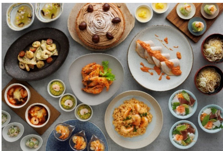
〈セリーナ『海老フェア』〉