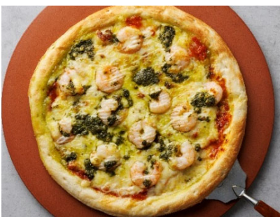
〈海老のジェノベーゼピザ〉