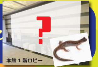
本館 1 階ロビー

01. 茨城県の絶滅危惧種「ツクバハコネサンショウウオ」の 巨大迷路に挑戦しよう! <13:30よりお披露目除幕式> 『ツクバハコネサンショウウオ“ミニ迷路”森のタンブラー』数量限定販売! 茨城県や筑波山系の生物多様性保全のため、森のタンブラーの売り上げの一部を寄付します