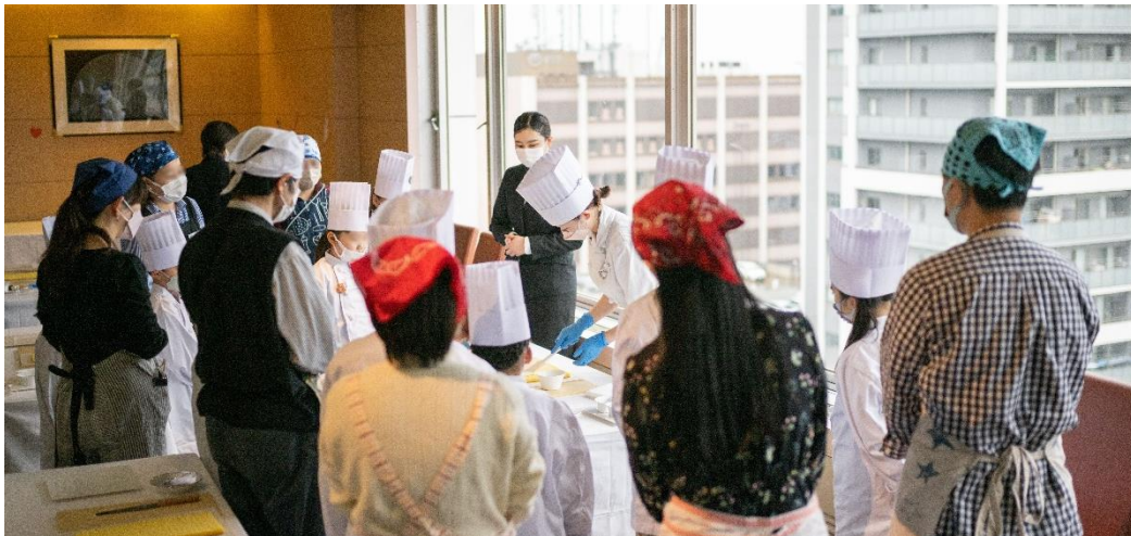
前回の開催風景(2022年11月23日)

本プロジェクトの第2弾として、市内のイチゴ農園「かわらけや」のイチゴを使った親子料理教室『イチゴなイチにち♪ホテルシェフに学ぶ料理体験！』を2023年3月21日(火・祝)に開催します。