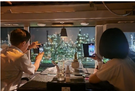
車内からの川崎工場夜景イメージ

本レストランバスプランは、川崎日航ホテル、ホテルメトロポリタン 川崎、川崎キングスカイフロント東急REIホテル、ホテル縁道から選べる宿泊付きで、ツアー後はゆっくりホテルでお過ごしいただけます。宿泊先のホテル近くで降車ができるのも魅力です。