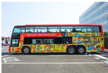
東京レストランバス外観

公式サイト URL： https://travel.willer.co.jp/restaurantbus/tokyo/