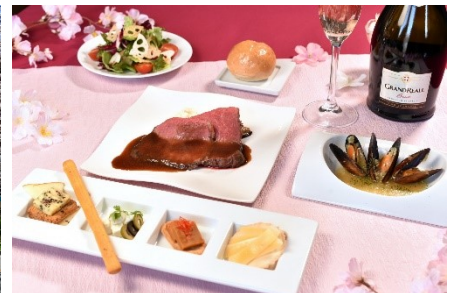
フレンチコースイメージ