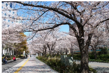
川崎駅線路沿いの桜並木 (ツアーでは夜桜を鑑賞)