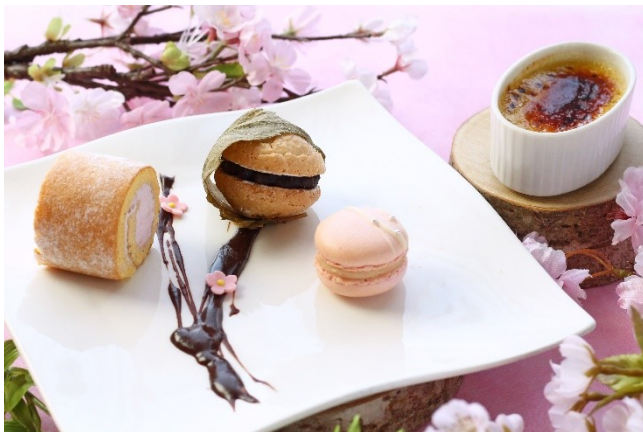
桜のスイーツプレート