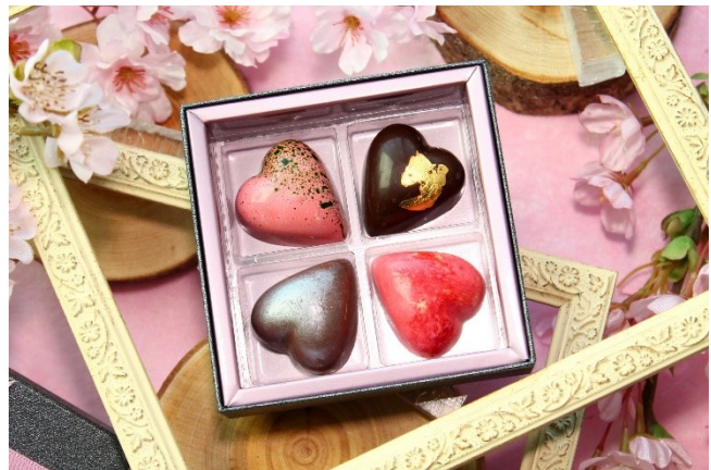
川崎の素材を使った「チョコレートアソート」