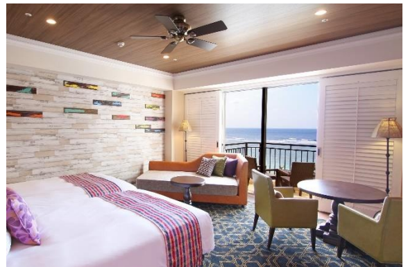
< 客室 イメージ >

年明けには一足早く春を迎える沖縄で記憶に残るひとときをお過ごしください。なお本プランは、現役学生以外の方もご利用いただけます。