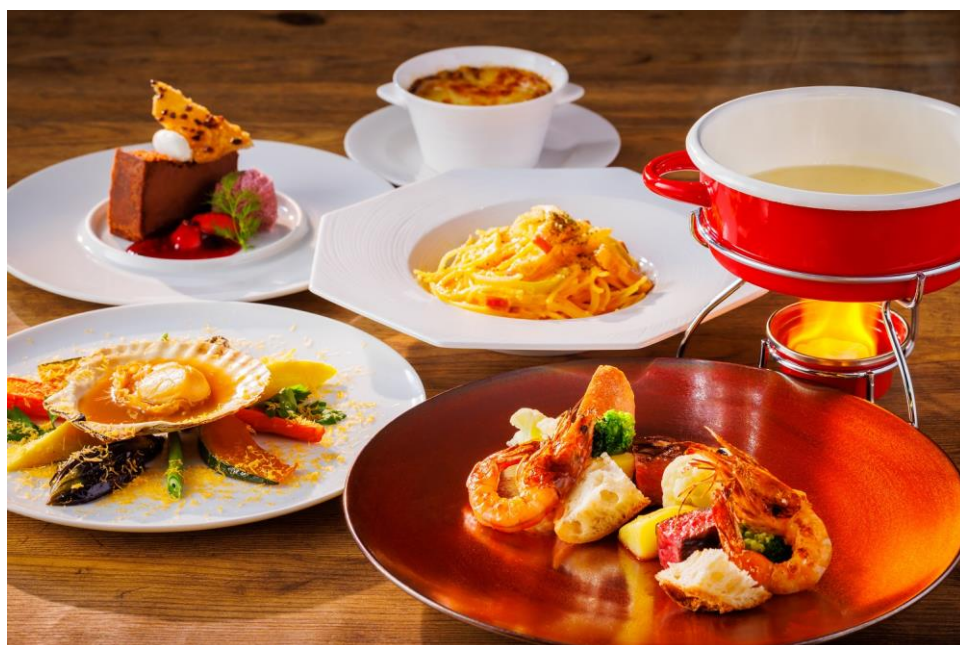
チーズ満喫コース

ホテル日航立川 東京（東京都立川市／総支配人 青柳亮司）のレストラン「All Day Dining 紗灯」（1階）では、2023年1月4日（水）から2月28日（火）まで『あったかチーズフェア』を開催。チーズづくしのコースや、限定アップグレードメニューが楽しめるプリフィックスランチセットなど、寒さが厳しくなる季節に身も心もあたたまるチーズメニューをご提供します。