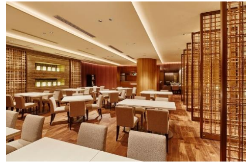
レストラン All Day Dining 紗灯

https://hotelnikko-tachikawatokyo.jp/restaurant/