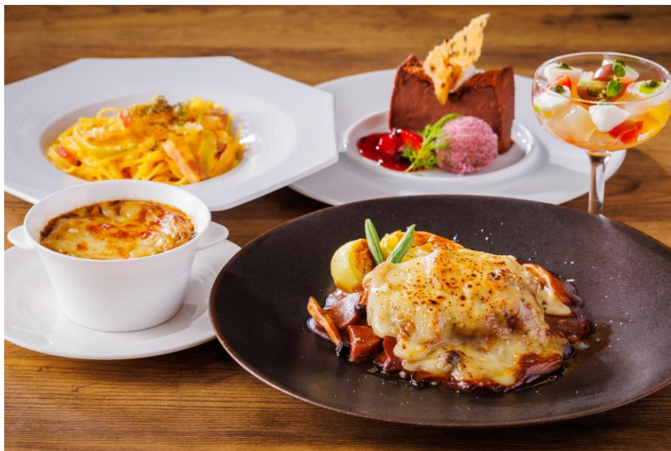
プリフィックスランチセットイメージ（写真の組み合わせで5,900円）

ランチタイム限定「プリフィックスランチセット」には、前菜・スープ・ハーフパスタ・メイン・デザートの各アイテムに、チーズフェア限定のアップグレードメニューを取り揃えました。