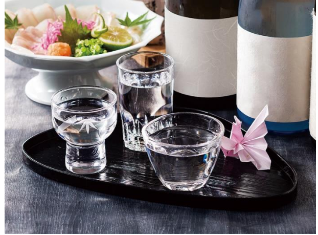
茨城の地酒3種飲み比べイメージ