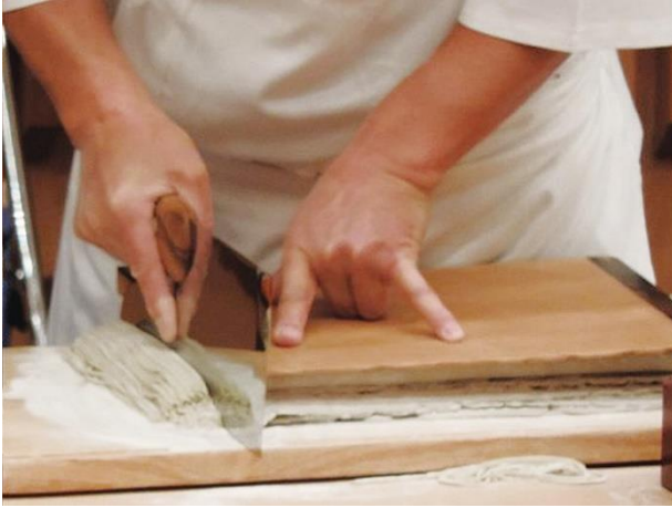
そば切り実演イメージ