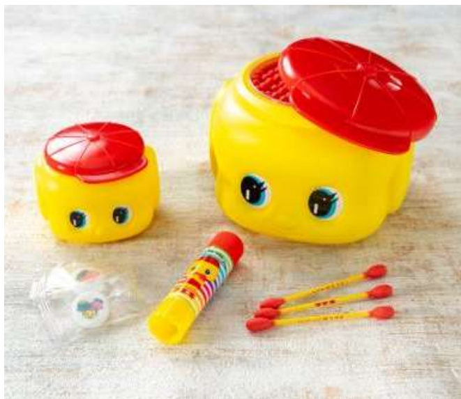
フェキくんグッズ イメージ・客室一例（スーペリアツインルーム）

心齋橋 PARCO に専門店もオープンした、「どうぶつのに」だけにとどまらないフェキくんグッズと初コラボレーション