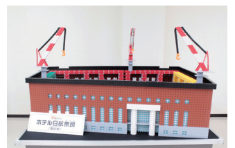
LaQで作られるホテル日航奈良

完成したものは8月中ロビーにて展示予定。“LaQ”で作った顔出しパネルも設置します。