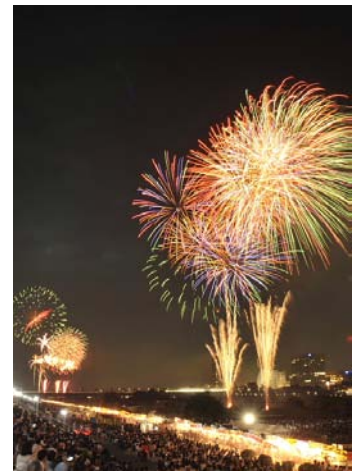
※多摩川花火大会の様様