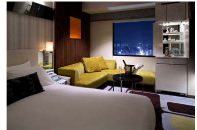
※エグゼクティブダブルルーム

□期間 2014 年 5 月 7 日 (水) ～2014 年 12 月 31 日 (水)