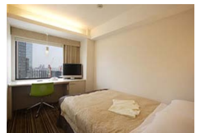
※スーパーアールーム

□期間 2014 年 5 月 7 日 (水) ～2014 年 8 月 31 日 (日)