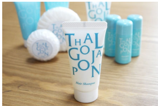
スイートルーム バスアメニティ&amp;コスメティクス イメージ画像