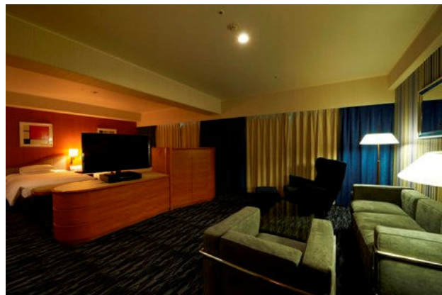
エグゼクティブスイート

【客室タイプ】ロイヤルスイート、エグゼクティブスイートツイン、エグゼクティブスイートダブル (3タイプ 全9室)