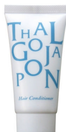
ヘアコンディショナー