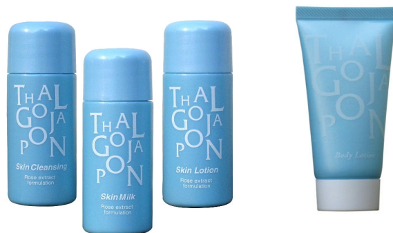
コスメティクス 3点セット