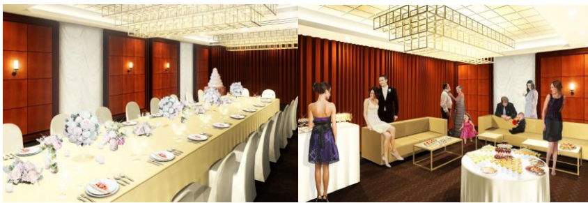
(プライベートバンケット「肥後」)

新たに誕生するのは、ヨーロッパクラシックをコンセプトとする邸宅風の会場、プライベートバンケット『肥後』。50名様までの披露宴に対応し、熊本を象徴する「銀杏」のモチーフとヨーロッパの壮麗さが調和した、気品漂うシックな空間。ソファスペースを備え、まるで自宅に招待するようなプライベート空間でゆったりとしたひとときをお過ごしいただけます。