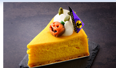
「ジャックランタン」

https://www.hno.co.jp/restaurant/lobbyslounge/sweets-order-buffet-halloween.html