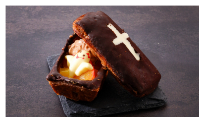
「棺のなかでは・・・」