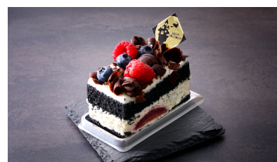
「ブラックハロウィン」