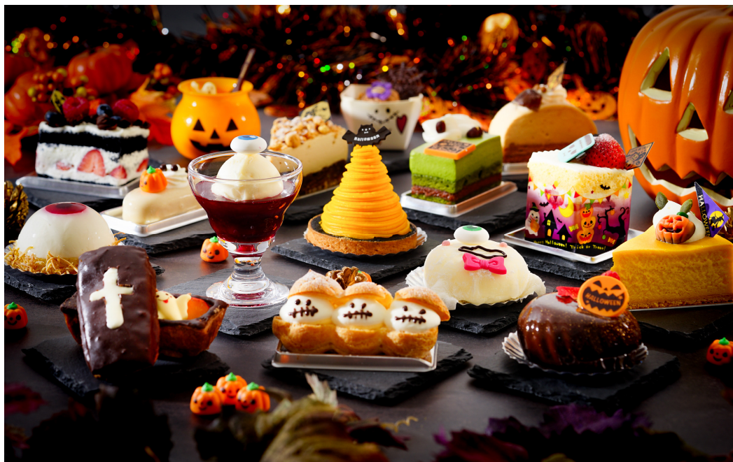
「ハロウィン・スイーツオーダーブッフェ」イメージ

「スイーツオーダーブッフェ」と「アフタヌーンティーセット」のスイーツが10月限定でハロウィンモンスターに大変身！インスタグラムキャンペーンも実施。