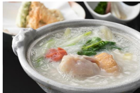
和彩「花ざと」五聖地会席 (1月「奈良」)