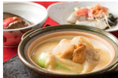
中華料理「桃李」桃李懷石 (1月)