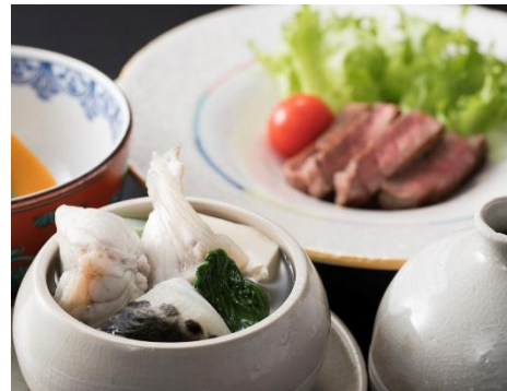
和彩「花ざと」五聖地会席 (12月「伊勢」)