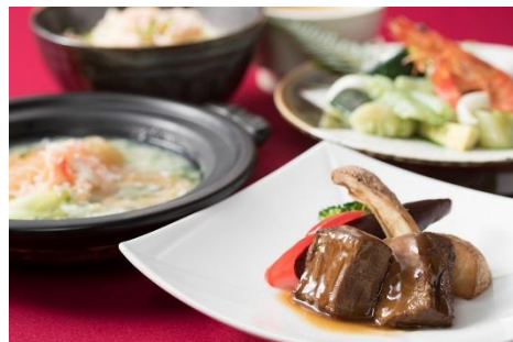
中華料理「桃李」桃李懐石 (12月)