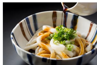
「ザ・ブラスリー」伊勢うどん (12月)