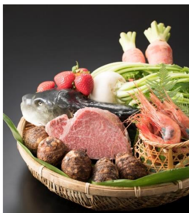
和彩「花ざと」/ 12月のこだわり食材

和彩「花ざと」「五聖地会席「伊勢」」は、三重県安乗沖の黒潮で揉まれ、非常に貴重な高級魚である“天然とらふぐ”「あのりふぐ」を徳利蒸しにし、三重県熊野市で発見された新しい香酸柑橘「新姫」を使用した自家製ポン酢で堪能いただきます。また、自社配合の栄養バランスに優れたエサを与え、こだわり肥育方法で育てられた伊賀牛はステーキでご提供いたします。一年の締めくくりに相応しい贅沢な冬の「伊勢」をお召し上がりください。