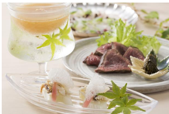
和彩「花ざと」五聖地会席 8月「淡路」