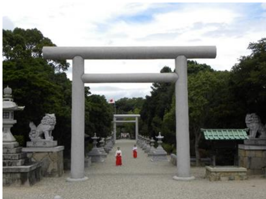
伊弉諾神宮正面鳥居

7月に伊勢から始まった食の旅は、今後9月は伊吹山、10月は熊野、11月は元伊勢、12月は伊勢へ戻る計画をしております。近畿を巡る道中で、今後見つけ出す優れた素材たちを、各料理長がどのように仕上げていくか、毎月わくわく感が止まらない企画となりますので、皆さまどうぞご期待ください。