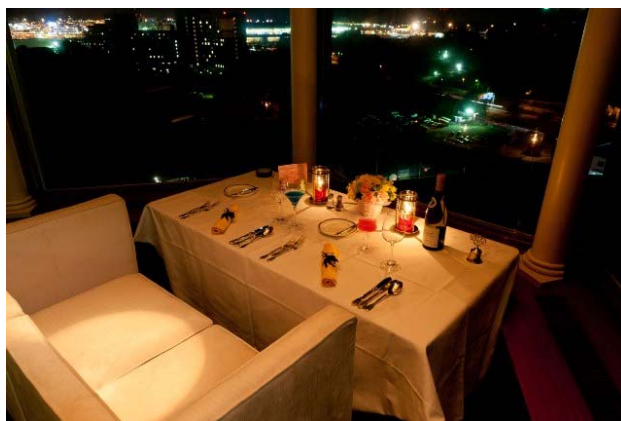
1日1組限定 カップルシート

三方向が窓のコーナーにあるカップルシートは1日1組限定で空港の夜景を眺めるベストポジション。飛行機が離発着する滑走路とターミナルが目の前に広がるラウンジで、お二人が並んで座り、ゆったりとお食事を楽しんでいただけます。