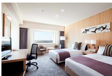
エグゼクティブツイン