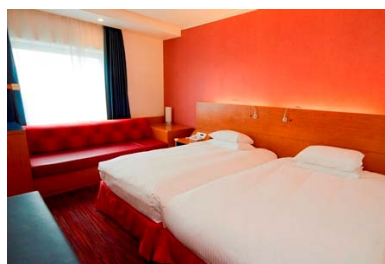
コンフォートツイン