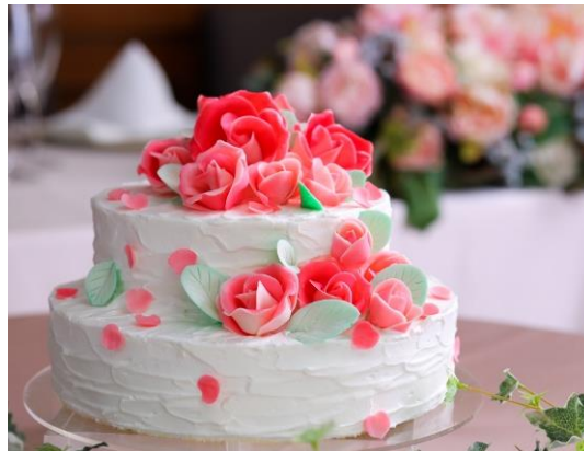
ゲスト一人ひとりにメッセージプレート添えて、感謝の気持ちを伝える