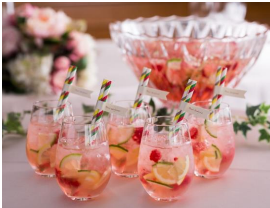
新たなカクテル「プールのトゥジュール」の誕生で、新しい家族のお祝い

上質感溢れるおもてなしの演出で、お二人やゲストにとって忘れられない特別な一日を叶えるウェディングプランです。