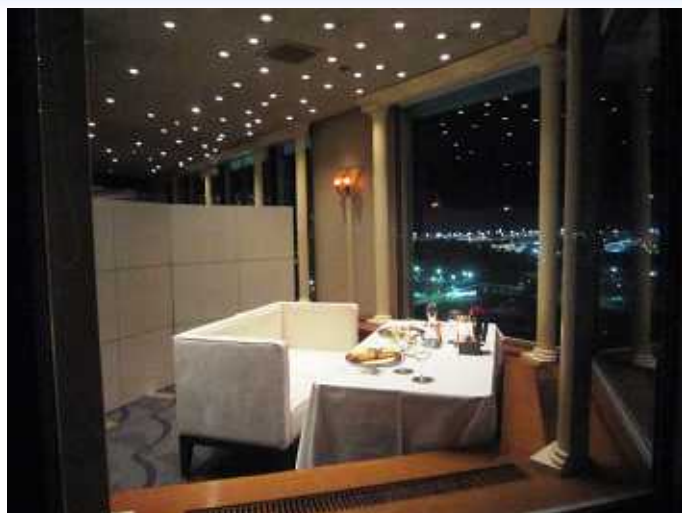
カップルシートは1日1組限定