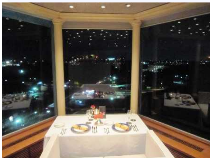
3方向が窓に囲まれたカップルシート