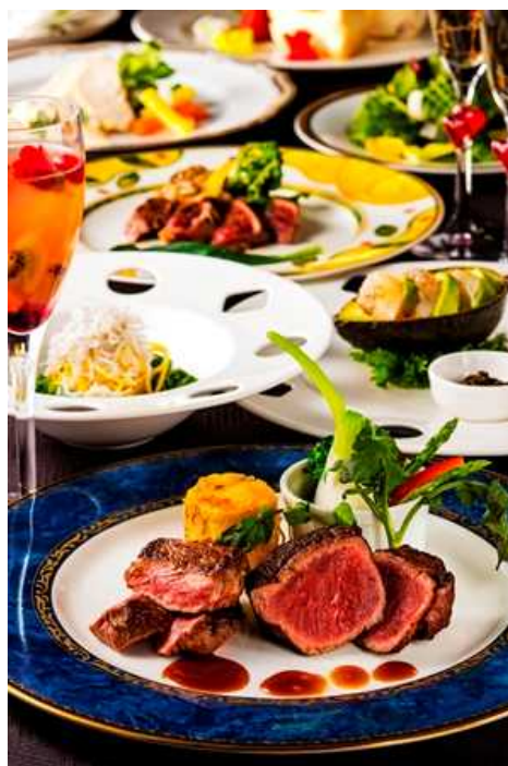
ホワイトデーディナー