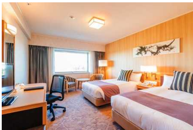
エグゼクティブツイン (33 m 2 )