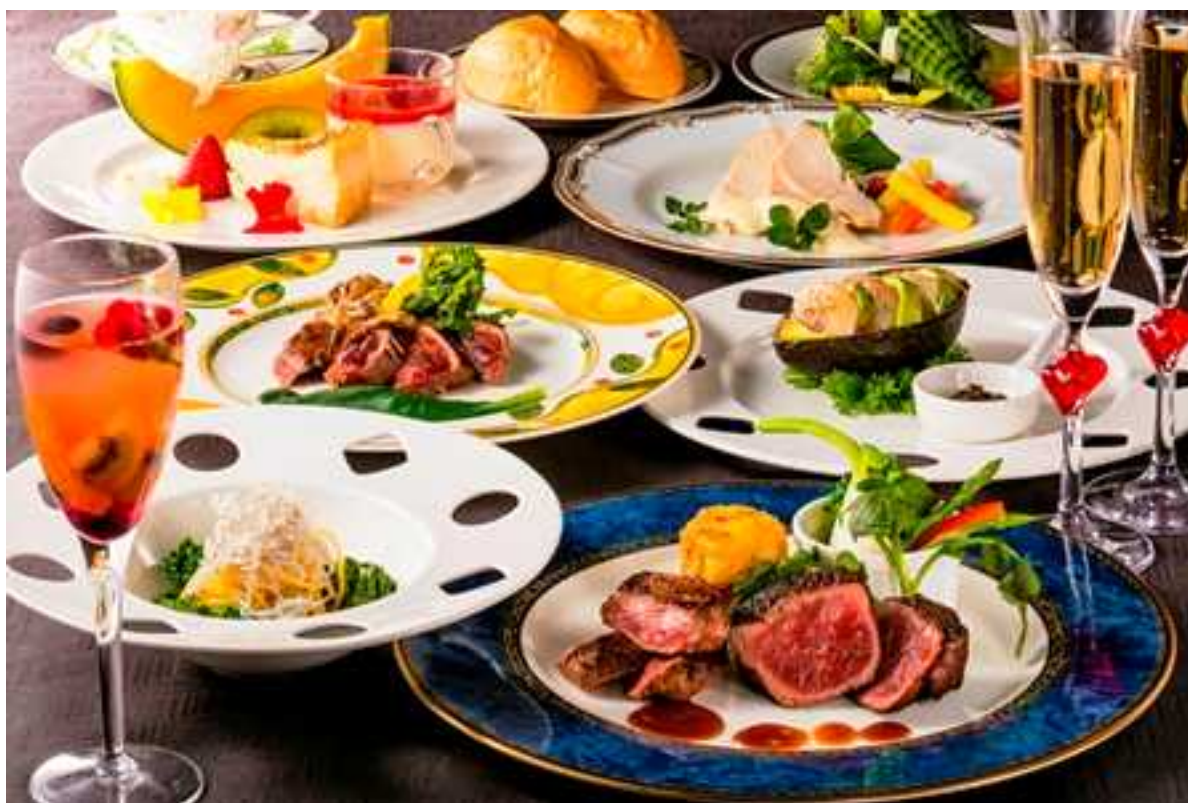
ハーフシャンパン付き ホワイトデーディナー

航空機が離発着する成田空港の夜景をご覧いただけ、ロマンチックなひと時をお過ごしいただけるサンセットラウンジでは、最初にご予約をいただいたお客様1日1組限定で、3方向が窓に囲まれた個室風のプライベート空間「カップルシート」をご利用いただけます。食前酒としてハーフボトルシャンパン1本がついた「ホワイトデーディナー」と朝食バイキングを含みお得にご宿泊いただけるプランもご用意いたしました。料金はエグゼクティブルーム（33㎡）お一人様21,500円（サービス料・税金込）またはコンフォートルーム（26㎡）お一人様20,000円（サービス料・税金込）となります。ディナーのみの場合はお一人様11,000円（サービス料・税金込）です。