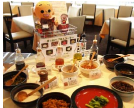
[ぶっかけご飯コーナー]