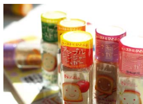
[シーズニングコーナー]