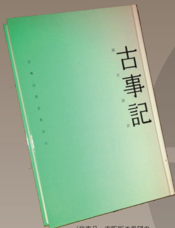
(非売品。市販版ご希望の方は下記をご覧ください。)

一般で購読をご希望の方は、市販版がありますので、書店でお求めください。市販版には詳しい解説と図表が付いています。