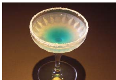
銀メダル／「銀の煌き（きらめき）」