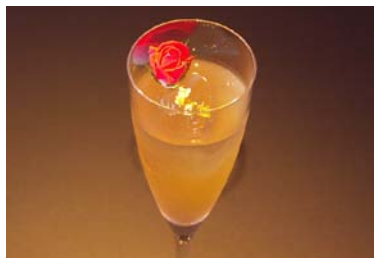
金メダル／「ゴールドンシャウト」