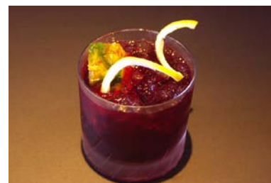
銅メダル／「ブロンズポップ」

お客様のお問合せ先 Tel.044-221-2145（バーラウンジ夜間飛行 直通）