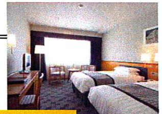
↑スタンダード ツインルーム

宿泊予約 0742-35-8831 ホームページ www.nikko-nara.jp