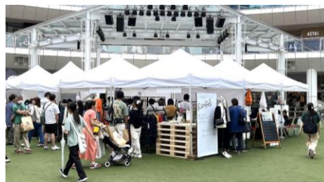
※過去のイベント風景