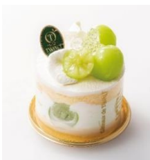
新宿高野 Gateaux シヤインマスカット 1,296円 (税込)

1F グラン・フード内店舗にて、旬の食材を使用した秋の味覚が味わえるスイーツやデリをご紹介。