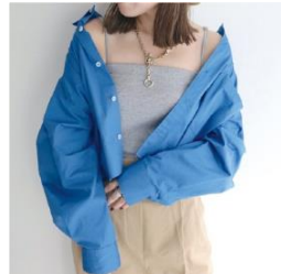
フレディ&グロスター/カットオフ デザイン クロップド 丈シャツ 7,480円 (税込)