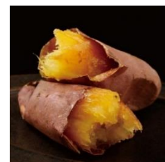
蔵出し焼き芋かいつか 熟成蔵 紅天使 8本 1,520円 (税込)