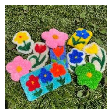
10月1日(土) タフティング体験 13:00/15:00/17:00 整理券配布時間：11:00～