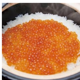
板前ごはん 音音/ 餐沢 北海道いくら土鍋ご飯 【1合】1,680円 (税込) ※ディナータイムメニュー