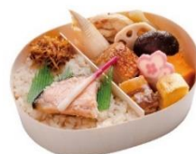
一汁旬菜 日本橋だし場

10月にもオープンを予定しております。詳しくは随時更新のウェブサイトをチェック！