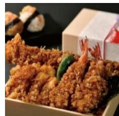
日本橋 天丼 天むす 金子半之助