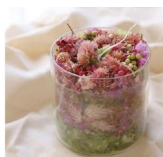
9月30日(金) ガラスキャンドルづくり 16:00/17:30/19:00 整理券配布時間：14:00～