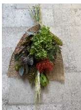
9月24日(土) ドライフラワースワッグづくり 13:00/15:00/17:00 整理券配布時間：11:00～