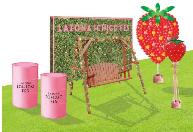
イチゴブランコ・イチゴバルーンのイメージパース

https://mitsui-shopping-park.com/lazona-kawasaki/