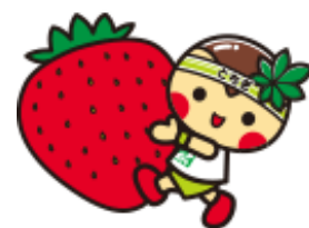
とちまるくん©栃木県