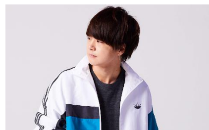
げんじ Fashion YouTuber