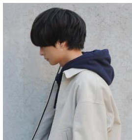
げんじ Fashion YouTuber

フーディ ¥5,990 (税込) ・レギンス ¥8,990 (税込) [Gap/GapKids] / 〈ラウゴア〉別注バッグ ¥9,790 (税込) [FREAK'S STORE] / スニーカー ¥15,950 (税込) [コロンピアスポーツウェア] / その他 私物