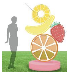
フルーツオブジェ

フルーツをテーマとしたルーファ広場には、フルーツオブジェやアートウォールなど、可愛いフルーツメニューといっしょに撮影したくなるような、フォトジェニックなスポットが鮮やかに彩られます。可愛くておしゃれでアーティスティックな空間で、素敵な時間を過ごしてみたいはいかがでしょうか。