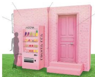
フォトジェニックピンクウォール