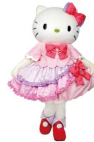
ハローキティと撮影会