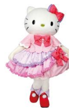
ハローキティと撮影会