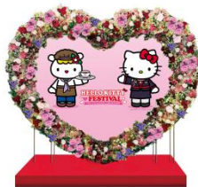
オリジナルフォトスポット