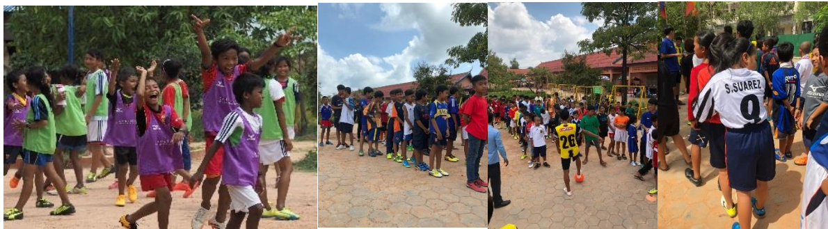
カンボジアでのサッカークリニックの様子(2017年7月・2018年9月)

概要 ソルティエロが運営するクラブチームの選手や海外拠点スタッフの協力により、サッカー用品の寄贈に加えて、子供たちにサッカーの基本技術やチームワークの大切さを伝え、学びの機会を提供してまいります。