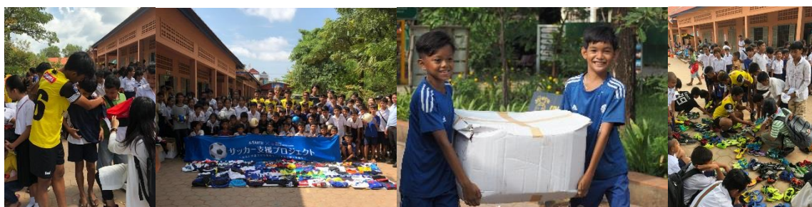
カンボジアでの寄贈の様子(2018年・9月)

三井不動産グループは、本プロジェクトの開催に併せ、『&EARTH 衣料支援プロジェクト』の同時開催を予定し、寄贈用品等の輸送費を日本救援衣料センター (JRCC) へ寄付してまいります。