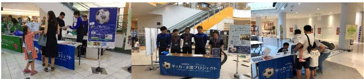
第3回の各会場でのサッカー用品回収の様子

実績の詳細については日本救援衣料センターHP ( http://www.jrcc.or.jp/ ) にてご確認ください。