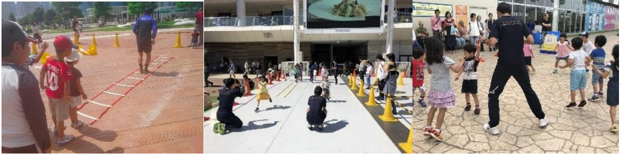
第3回の各会場でのイベントの様子